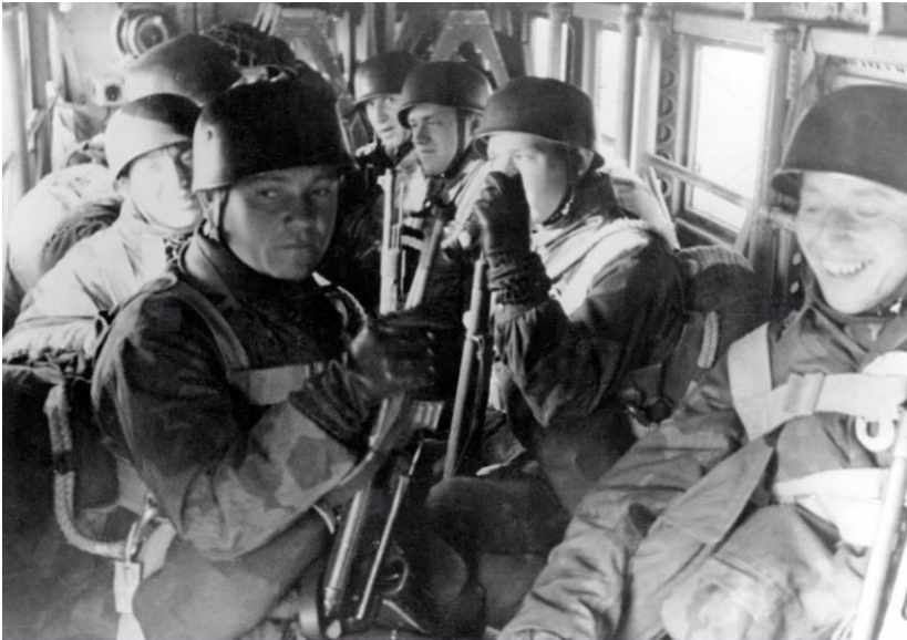
In den frühen Morgenstunden des 25. Mai 1944 startete die Operation Rösselsprung. Fallschirmjäger des SS-Fallschirmjäger-Bataillon 500 in einer Junkers Ju 52 auf dem Flug nach Drvar in Bosnien. Das SS-Fallschirmjäger-Bataillon 500 war eine Spezialeinheit der Waffen-SS. Ihr erster Auftrag führte sie tief in das Herz des feindlichen Territoriums, mit dem Ziel, den kommunistischen Partisanenführer Tito zu töten oder zu fangen. Man beachte die Enge und die ungeschützten Waffen, die sie bei sich tragen. Munition und Nachschub wurden in externen Waffenbehältern transportiert, die zur gleichen Zeit abgeworfen wurden.

Hintergrund: 1941 mussten wir in dieses Gebiet einmarschieren, um pro-alliierte Kräfte zurückzudrängen und eine drohende Invasion zu verhindern. Dieses Gebiet war schon vor dem Ersten Weltkrieg sehr pro-russisch und antideutsch eingestellt gewesen. Als wir das Gebiet eroberten, hielten es unsere Führer für klug, die meisten Kriegsgefangenen freizulassen und ihnen zu erlauben, nach Hause zurückzukehren, und wir bauten Heimatschutzeinheiten auf, um den Frieden zu wahren. Das war ein Fehlschlag; als wir abzogen, begannen sie sich gegenseitig zu bekämpfen. Kommunisten zogen ein und organisierten sich, so dass der Balkan bis 1943 zu einem Zufluchtsort für Deserteure, Gesetzlose und die Alliierten wurde. Sabotage war ein Problem, wurde aber von den örtlichen befreundeten Milizen unter Kontrolle gehalten. Die größte Sorge war eine Invasion an einer sehr offenen Front. Es wurde beschlossen, dass die neu gebildeten SS-Fallschirmjäger diesen Überraschungsangriff anführen sollten.