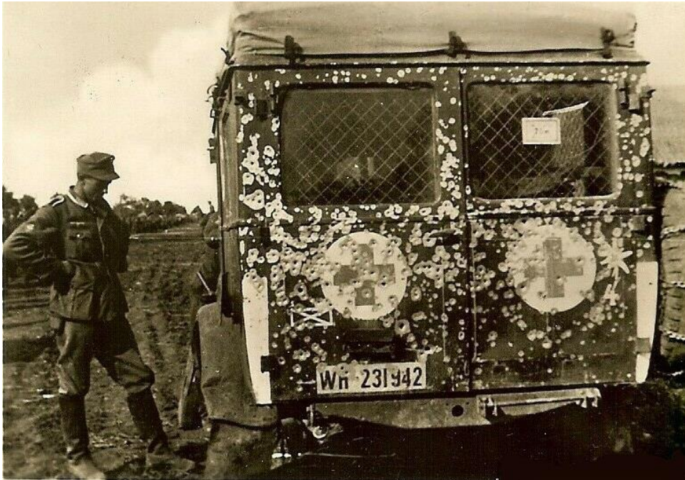
Die Alliierten brachen jedes Tabu, jede Kriegsregel und jede Konvention. Nicht einmal die Krankenhäuser und Fahrzeuge des Roten Kreuzes waren vor ihren Mordmaschinen sicher. Dieses Foto zeigt einen Krankenwagen des Roten Kreuzes, der 1941 von sowjetischen Truppen in der Nähe des Flusses Dnjepr in Stücke geschossen wurde.

Soweit ich weiß, waren die Alliierten hart zu den Deutschen, insbesondere zur SS, da die Verbrechen, die ihnen vorgeworfen werden, die alliierten Soldaten verärgerten. Glauben Sie, dass das einen Teil ihrer Behandlung rechtfertigt?