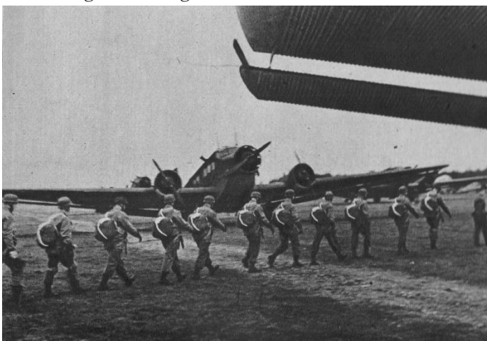
Eine Gruppe von deutschen Fallschirmjägern nähert sich einer Junkers Ju-52 Transportmaschine und hat gleich ihren ersten Sprung.