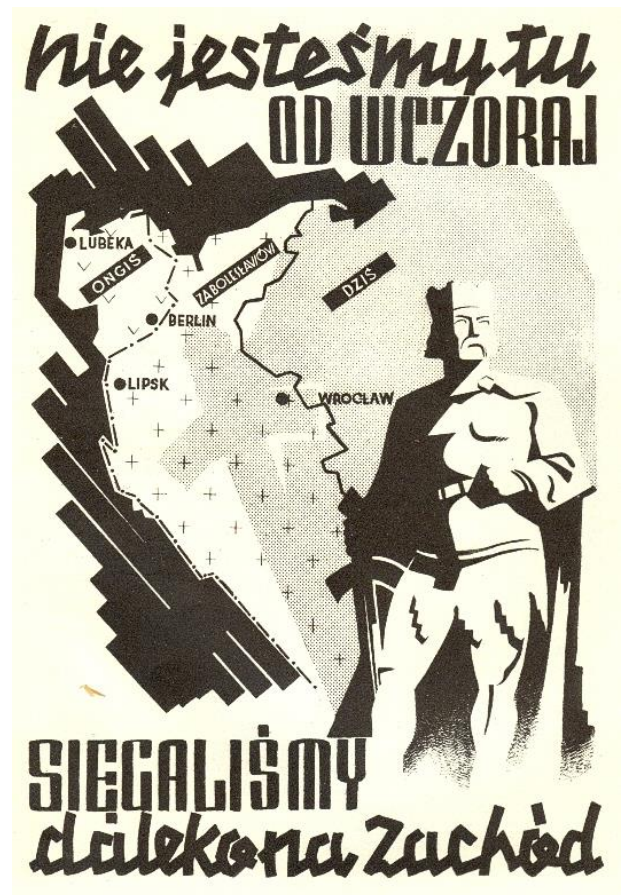
Polnisches Propaganda-Poster: „Wir sind nicht erst seit gestern hier - einst Lübeck und Berlin - Leipzig und Breslau gehörten König Boleslaus - heute (nur Polen in den Grenzen bis 1939). Wir waren weit nach Westen vorgedrungen.“

einer Fallschirmjägergruppe teilgenommen hatte, also wurde ich auf die Idee angesprochen und stimmte zu. Es sollte eine reine Freiwilligeneinheit sein, mit einem kleinen Kader von Soldaten, die gegen das Militärgesetz verstoßen hatten und sich rehabilitieren konnten. Ich möchte mit einem Mythos aufräumen, der heute weit verbreitet zu sein scheint: Diese Einheit war keine Strafeinheit. Wir nahmen keine Männer auf, die wegen schwerer Verbrechen verurteilt waren. Ein schweres Verbrechen in der SS konnte so einfach sein wie der Diebstahl eines Brotes von einem Zivilisten bis hin zu einer illegalen Tötung. Bei einigen Delikten wie Vergewaltigung und Mord wurde ein Erschießungskommando eingesetzt.