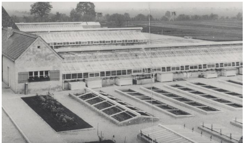
KL Dachau: Die Verkaufsstelle (links) und Gewächshäuser im „Kräutergarten“, Aufnahme der SS, 1941

Der Lagerkomplex war sehr sauber, Blumen und ein großer Garten vermittelten den Eindruck eines ruhigen Ortes und nicht eines Gefängnisses. Die Gefangenen waren größtenteils politische Kriminelle, die Verbrechen oder Anstiftung zum Terror gegen den neuen nationalsozialistischen Staat begangen hatten. Ich lernte einen Gefangenen kennen, der 5 Jahre für das Verteilen von kommunistischen Flugblättern